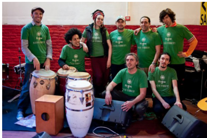
Ojos de Brujo, comprometidos con el Tíbet.